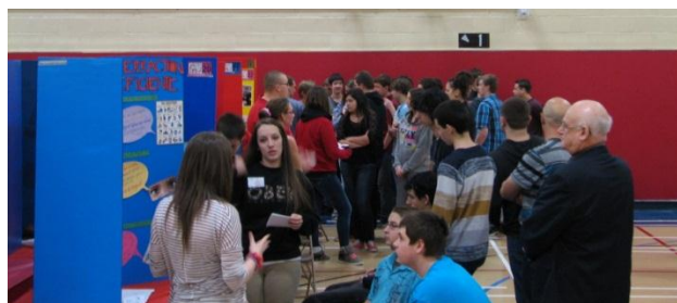
Les exposants reçoivent les visiteurs et expliquent leurs présentations.