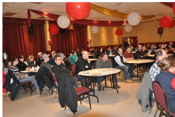
Figure 1

Selon la directrice adjointe du CFP Mont-Joli-Mitis à la Commission scolaire