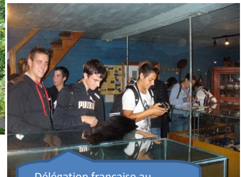
Délégation française au Musée du Vieux Moulin.