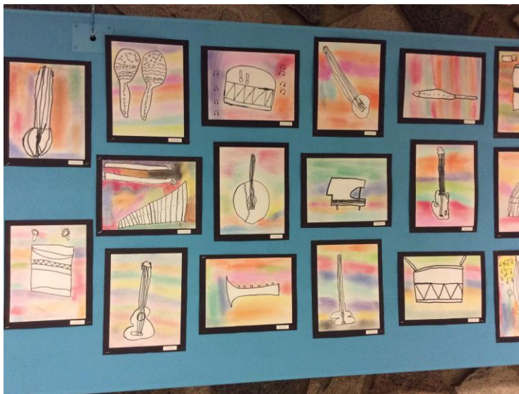
Les élèves de l'école du Rocher-D'Auteuil ont réalisé un projet artistique pour souligner la Journée internationale de la musique.

Rimouski, le 16 décembre 2014 – L'école du Rocher-D'Auteuil a souligné de façon créative la Journée internationale de la musique, le 1 er octobre dernier. Les élèves ont eu l'occasion de réfléchir sur l'importance de la musique dans leur vie quotidienne et d'exprimer leurs idées par écrit. De plus, tous les élèves de l'école ont participé à la réalisation d'un projet en art visuel pour poursuivre la célébration de la Journée internationale de la musique.