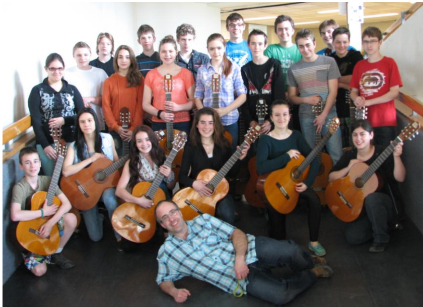
L'ensemble de guitares Impact

L'ensemble de guitares Relève, qui regroupe des élèves de première secondaire, a obtenu le superbe résultat de 90 %, ce qui lui a valu la note d'or. L'ensemble de guitares Impact, formé d'élèves de deuxième secondaire, a décroché pour sa part un résultat non moins méritoire de 91 %. Il a également gagné la note d'or dans sa catégorie.