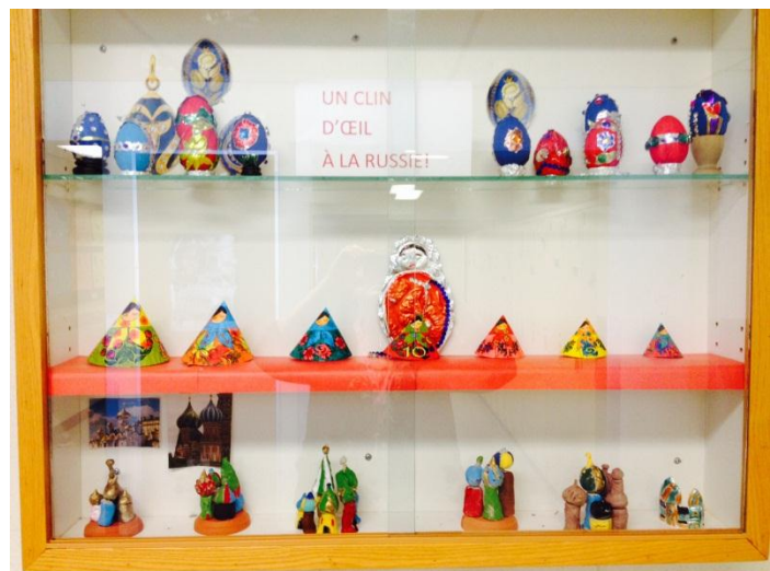
Les élèves du service de garde La Bricole présentent leurs poupées russes.

Lors du concert, les œuvres picturales d'inspiration russe réalisées par les élèves de l'école seront projetées sur un écran pour accompagner la musique du compositeur Moussorski, « Les tableaux d'une exposition ». Les élèves du service de garde La Bricole participent également à l'événement en exposant leurs poupées russes dans le hall de la salle de spectacle Desjardins-Telus à partir de 18 heures le soir même.